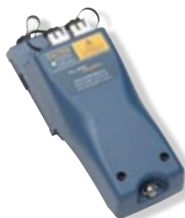
Модуль DTX Compact OTDR