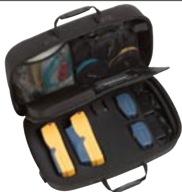
Полный набор DTX Compact OTDR для сертификации и устранения неисправностей