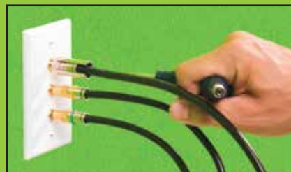
Tighten or Loosen Cable TV "F" Connectors Serrer ou desserrer des connecteurs « F » de câble TV Aprieta o afloja conectores "F" para TV por cable