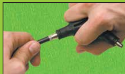
Flair Shield Braid Évaser un blindage tressé Abocinado de trenzado de coraza