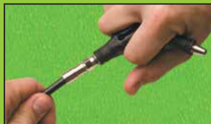
Attach Cable TV "F" Connector to Cable Poser un connecteur « F » sur un câble TV Acopla el conector "F" de TV por cable al cable