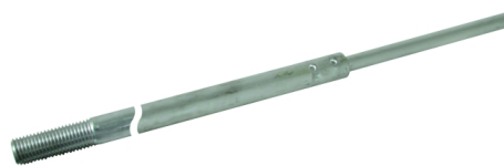
Оригинал может отличаться от изображения