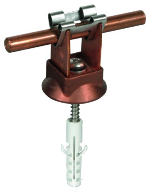
Оригинал может отличаться от изображения