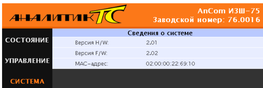
Рисунок 3.3.2.3. Web-интерфейс, страница «Система»

3) на странице «Система» (рис.3.3.2.3) отображаются сведения о системе.