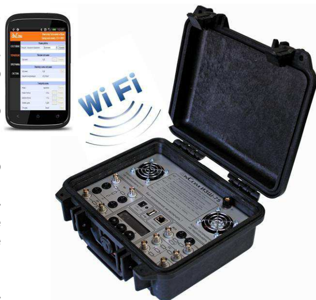
Рисунок 1.1 AnCom ИЗШ-75

Конструкция AnCom ИЗШ-75 выполнена в виде ударопрочного чемодана, в основании которого установлен приборный блок (ПБ), а в крышке расположены Wi-Fi маршрутизатор, портативное средство удалённого управления (смартфон на базе ОС Android ), а также зарядные устройства, комплект кабелей, переходники и документация (табл.1.2).