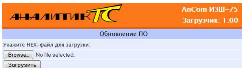
Рисунок 4.1. Web-интерфейс загрузчика ПО