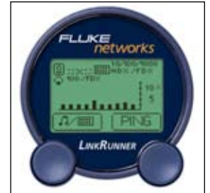
Узнайте возможности устройства, действительную скорость соединения и уровни загрузки.