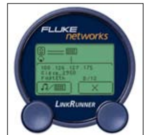
Точно определит порт коммутатора с помощью Cisco Discovery Protocol.