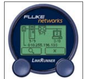
При помощи функции Ping проверьте связь с DNS-сервером или ключевыми устройствами, обратите внимание на время отклика.