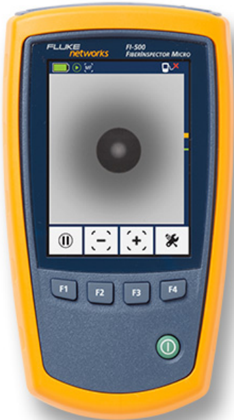
Информация для заказа

FI-500 отображает чистую торцевую поверхность оптоволоконна